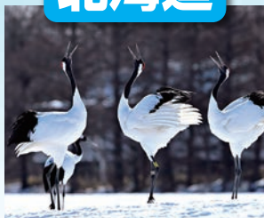
釧路湿原 / 最寄: たんちょう釧路空港