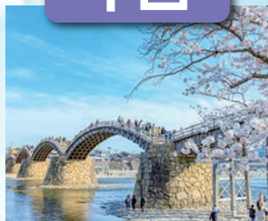
錦帯橋 / 最寄: 岩国錦帯橋空港