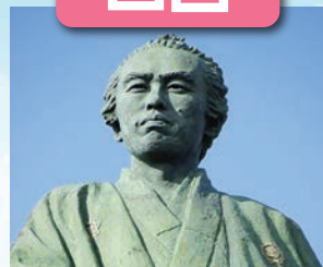
坂本龍馬像 / 最寄: 高知龍馬空港