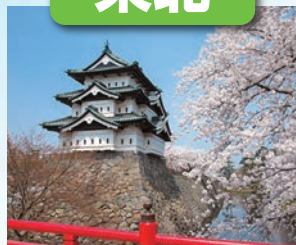
弘前城 / 最寄: 青森空港