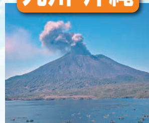
桜島 / 最寄: 鹿児島空港